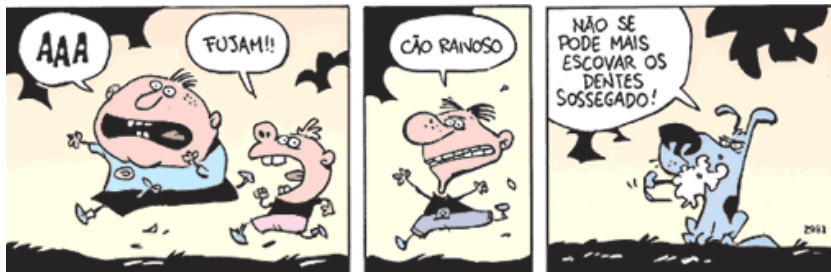
Figura 34: Tira nas Atividades. Disponível em http://www2.uol.com.br/niquel/seletas_mundocao.shtm 7, acessado em 28/08/2014

no 7º ano. O número de questões subjetivas, de cópia e de vale-tudo, que pouco contribuem para o aprimoramento da compreensão leitora, é baixo; no entanto, as questões globais, importantes por levarem em conta o texto como um todo, também aparecem em pequena quantidade. Vejamos na figura 34 mais uma tira do Níquel Náusea, presente no tópico Atividades do 7º ano.