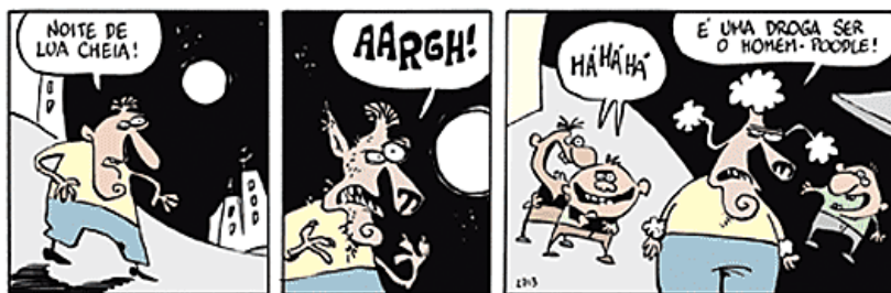
Figura 33: Tira no livro didático Jornadas.por (DELMANTO; CARVALHO, 2012).

O tópico Divirta-se tem o objetivo de descontrair. Aparece no meio e/ou fim da unidade, pode ou não fazer relação com o gênero desenvolvido na atividade de leitura da unidade e, normalmente, aparece sem qualquer exercício de compreensão, como se pode ver na figura 33, uma tira de Níquel Náusea no livro do 9º ano, o que sugere que o LDLP ainda está coaduna com a ideia de que a função das tiras é apenas divertir.