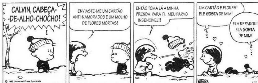
Figura 35: Tira para trabalhar variação linguística. Disponível em http://photos1.blogger.com/blogger/8140/903/1600/Calvin1.jpg acesso em 19/08/2014

calvin * hobbes POR BILL WATTERSON TRADUÇÃO DE HELENA GUBERNATIS